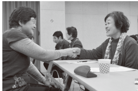
握手してごあいさつ