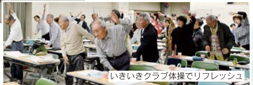
いきいきクラブ体操でリフレッシュ