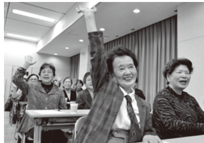
早口言葉上手にできました

11月10日(火)、城南保健所講堂にて単位クラブ女性部長研修会が実施されました。今回の研修では「生活の中に運動を取り入れよう」と